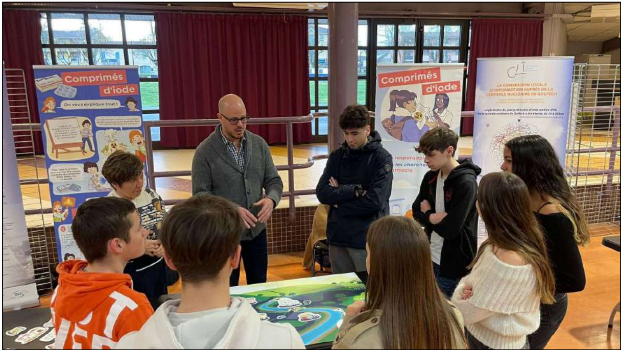
Sur le stand de la CLI de Golfech lors de l'évènement Atom'investigations, mardi 28 février 2025 à Castelsarrasin.