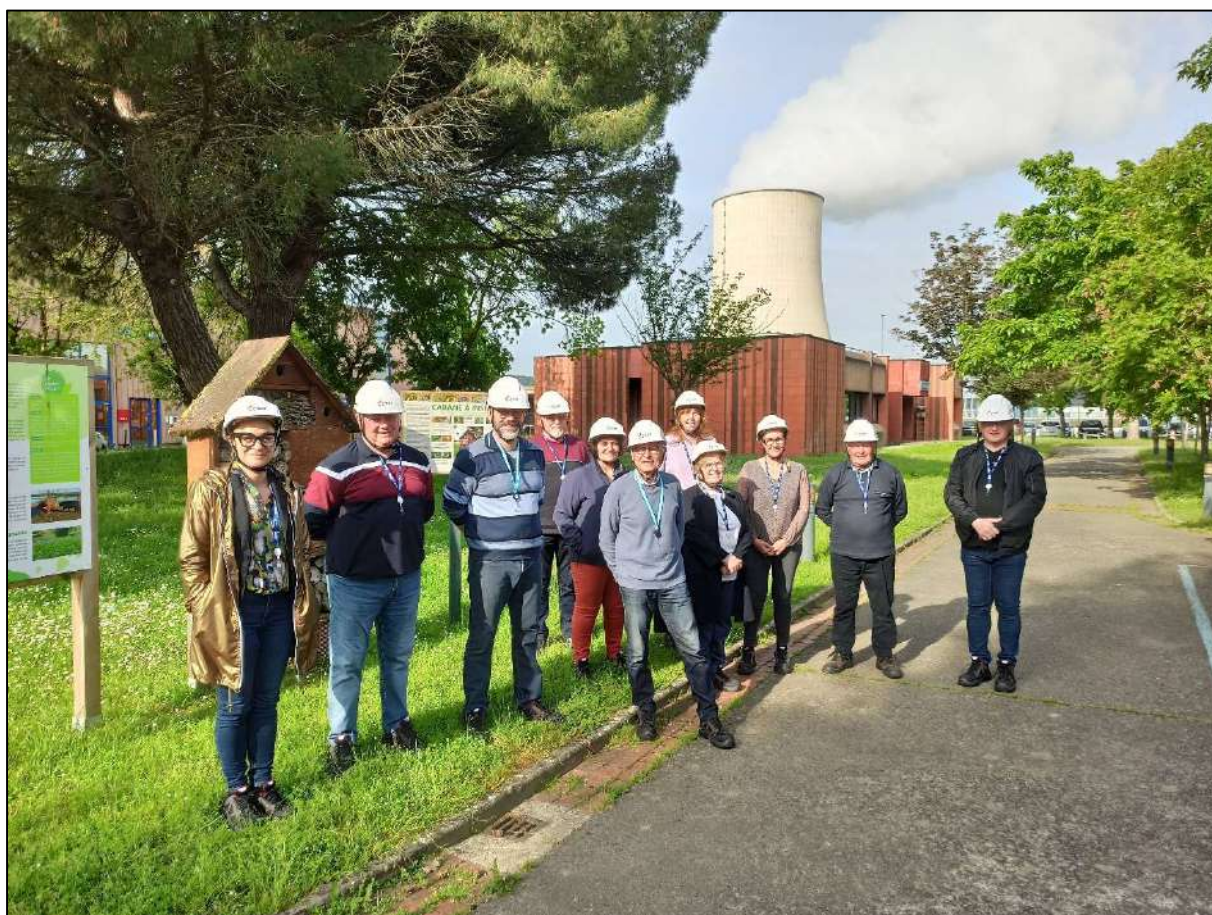
Visite de la centrale nucléaire pour les membres de la CLI de Golfech, le 13 mai 2024.