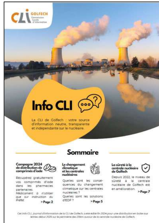
Couverture de l'InfoCLI 2024